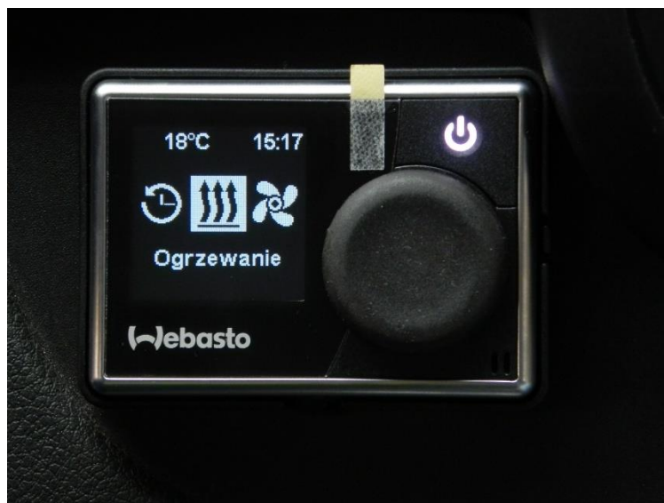
Zegar MultiControl HD