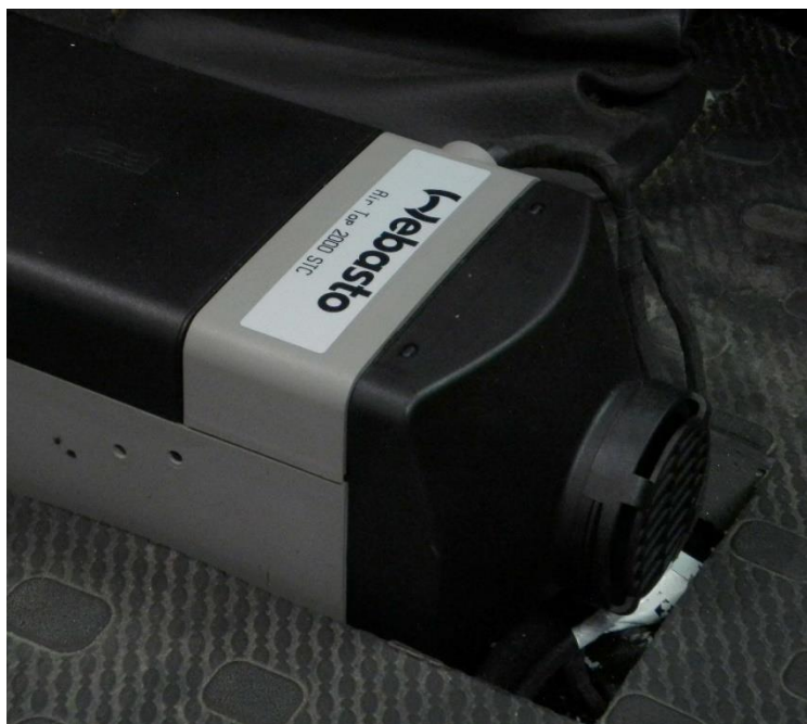
Agregat Air Top 2000 STC